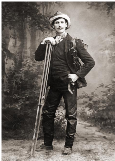
Borg Mesch i början av 1900-talet

År 1899 flyttade han med sin familj till Kiruna. Där hade han sin fotoateljé i ett skjul vid Luossajärvi. Bostaden byggdes av virke från fläsk- och dynamitlådor. Mörkrumsarbetet fick ske utan elektrisk ström och han fick skölja plåtarna i en bäck och ha vatten i en stor låda som bars upp till baracken.