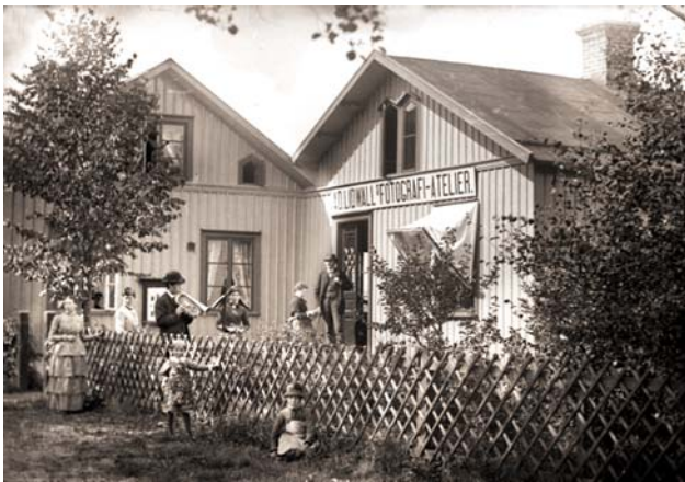
Fotoateljén i Tidaholm