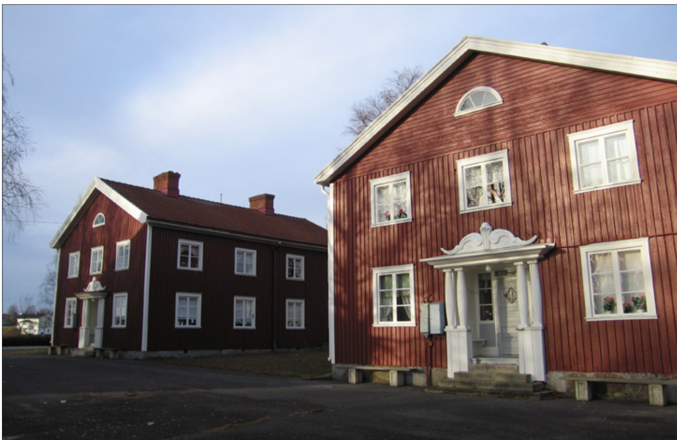
Kyrkstugor i Burträsk kyrkstad, ritade av arkitekt Birger Dahlberg 1933.