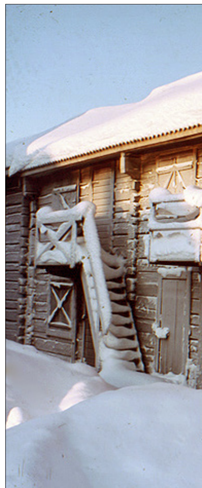
Två utanpåliggande loftbroar till övre våningens kammare i Bonnstan, Skellefteå kyrkstad.

På 1800-talet blev det vanligare att kyrkstugorna byggdes större och delades upp i flera kamrar, ofta mellan sex-åtta stycken, tillhörande olika ägare eller familjer. Ofta gick man ihop byavis och uppförde dessa kyrkstugor gemensamt. Österjörns kyrkstad