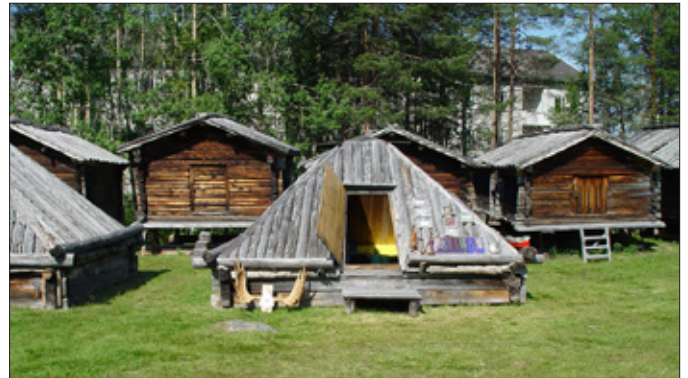
Skogssamisk kåta i Malå lappstad.

nadsdelen är bågstången i björk som måste ha den rätta böjen. Lämpliga krumväxta björkar kan man hitta vid kraftiga sluttningar och raviner där stammarna tyngts ned av snö och is. Två bågstänger bildar stommen i bygget, deras storlek och form avgör måtten på den färdiga kåtan.