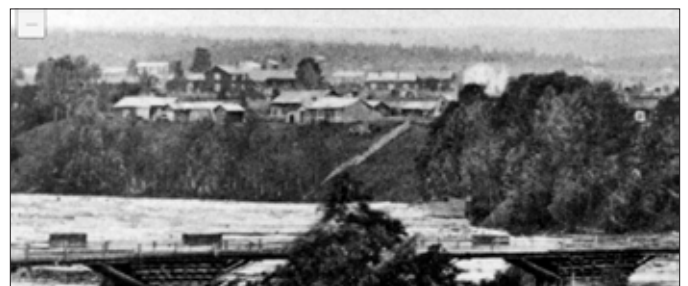
Foto av Kläppen från Sunnanå-sidan i början av 1860-talet. Där fanns 76 kyrkstugor och fyra borgarhus. Längst till höger skimtar prostgården. För karta se sid 6.