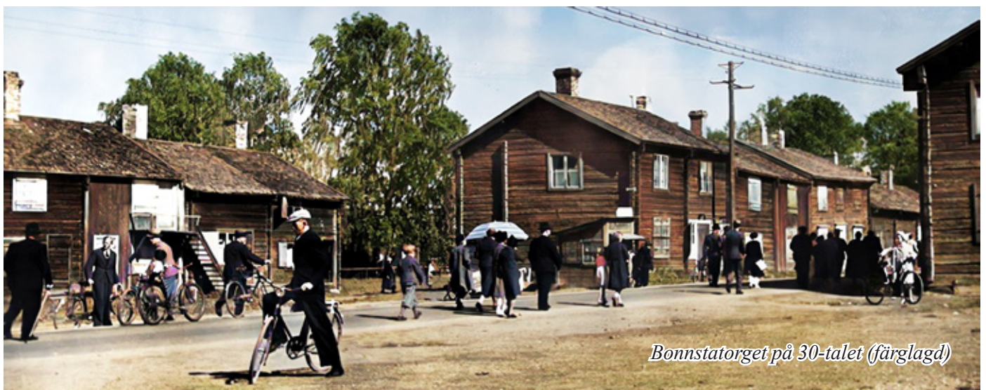
Bonnstatorget på 30-talet (färglagd)