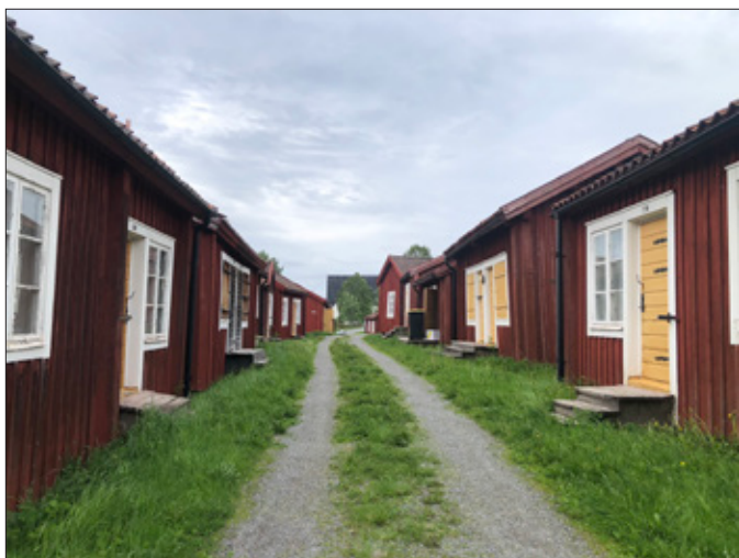
Tvåkammarstugor i Lövånger kyrkstad.

Kyrkstäderna i Västerbotten kan delas in i bonnstäder, finnstäder och lappstäder. De kyrkstäder som var byggda av bönder kallades bonnstäder, såsom i Skellefteå och i Byske. Bonnstan i Skellefteå är den av Västerbottens kyrkstäder som av länsstyrelsen bedöms bäst ha behållit sin genuina karaktär. Kyrkstugorna där är i första hand uppförda efter en brand 1835 och innehåller ofta omkring åtta kammare, även om det även finns mindre hus. Unikt för denna kyrkstad är de utanpåliggande loftbroarna som ofta leder upp till andra