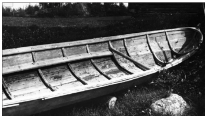
Kyrkbåt från Bygdsiljum. Observera sittbänkar längs relingarna. Foto 1928 av Ragnar Jirlow/Nordiska museet.

större båtar med tre par åror som var ca 8,5 m långa som rymde 16–18 personer. Dels hade man mindre båtar med ett eller två par åror. Båtarna kunde ägas av båtlag eller enskilda personer. På 1700-talet finns även uppgifter i domböcker att man rodde från Östra Falmark. Sannolikt har man åkt med båt längs Bureälven till Bodaträsket och sedan över den sjön till Båtviken. Därefter har man gått längs bäcken över till havet vid Yttervik. Där hade man en annan båt och färden fortsattes över Ytterviksfjärden, Småälvarna, över till Skellefteälven och vidare till kyrkan. Från Burvik finns muntliga uppgifter om kyrkbåtar. Även byn Hjoggböle vid Bureälven rodde vid kyrkbesök längs Burälven fram till Långviken och därifrån använde man vägen till kyrkan i Skellefteå. Byarna vid Skellefteälven nedströms kyrkan samt byn Lund rodde också till kyrkan i äldre tid. Ytterursviken fick väg i början av 1820-talet men vägen var tänkt att användas när isen varken bar eller brast. Alltså sommartid med båt och vintertid med häst och släde. Kyrkbåtarna i området fick en fortsättning 1867 när små ångbåtar sattes in på Skellefteälven vilka gick ända ner till Burvik. Även till kyrkorna i Burträsk, Kalvträsk, Lövånger och Malå har kyrkbåtar använts.