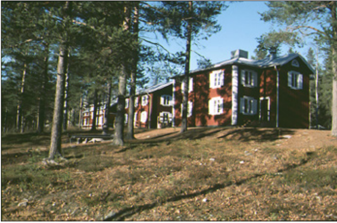
Två av de stora kyrkstugorna i Österjörns kyrkstad.

våningens kammare istället för en invändig trapp. De gamla nedbrunna husen i Burträsk kyrkstad, varav ett sista idag finns kvar, ska i sin tur ha varit de enda bland landets kyrkstäder med utanpåliggande loftgångar.