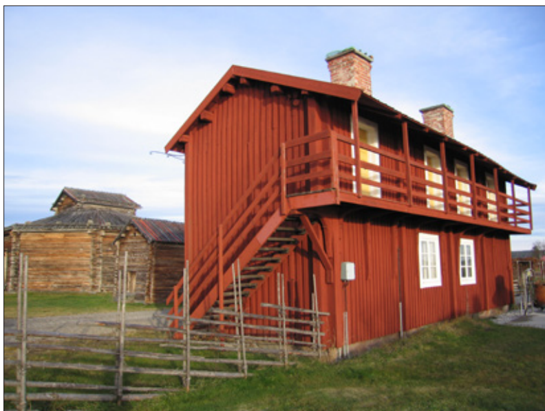
Den enda kyrkstuga som överlevde branden i Burträsk kyrkstad 1930, med den karaktäristiska loftgångsbron bevarad.