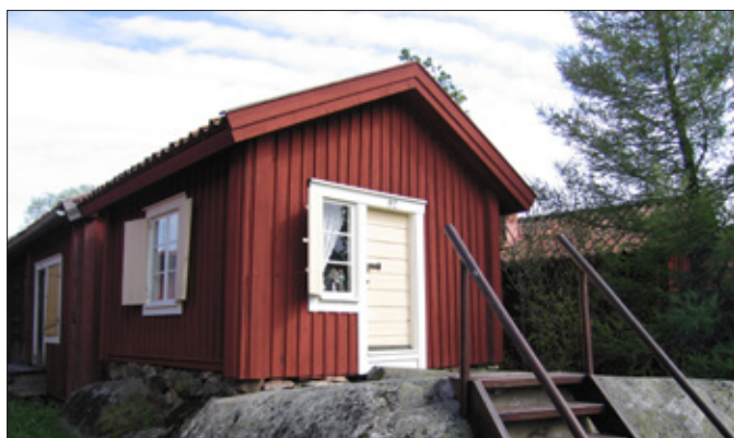
Liten enkammarstuga i Lövånger kyrkstad.

Den 20 mars 1695 utfärdade Västerbottens läns landshövding Gustaf Douglas en förordning om rätten att inneha kyrkstuga. Enligt förordningen hade varje hemman rätt till en kyrkkammare samt ett kyrkstall. I kyrkstäder med äldre byggnadsbestånd har kyrkstugorna ofta varit mindre med en eller två kammare och därmed med endast en eller två ägare (eller familjer). Lövånger kyrkstad är ett exempel på en kyrkstad med denna typ av kyrkstugor som bedöms vara uppförda på 1700- och 1800-talet.