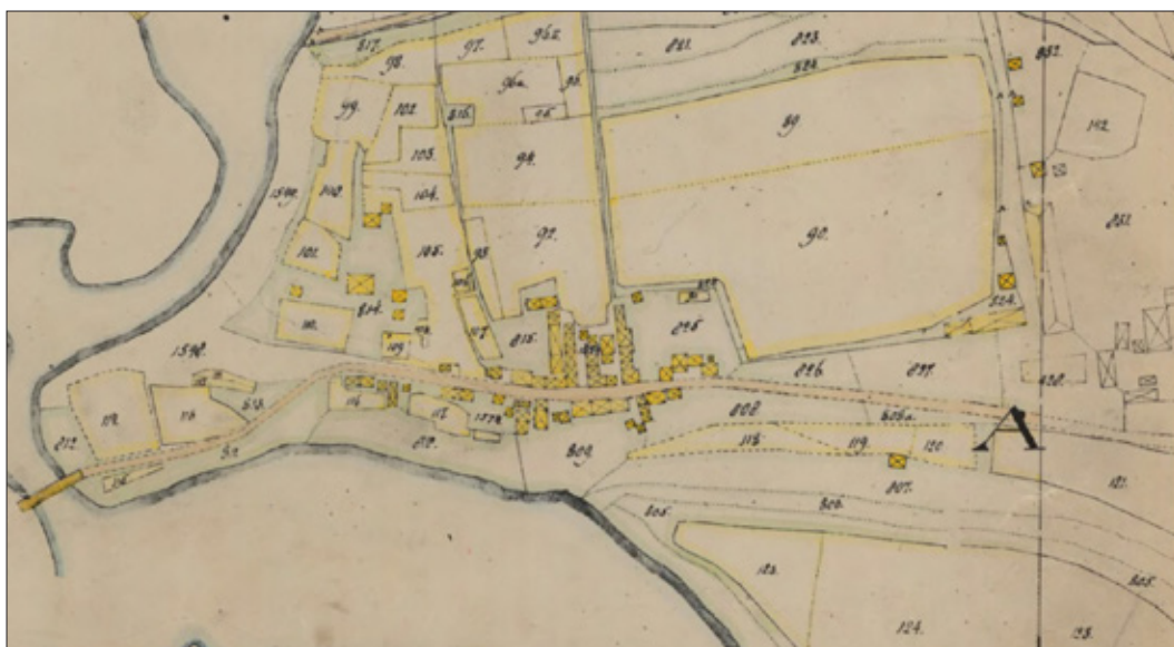
Karta över Kläppen strax före 1850 med 76 kyrkstugor och fyra borgargårdar. Längst till höger prästgården och till vänster bron över Klintforsån med landsvägen mot Norsjö.

Detta skapade sådana konflikter att kungen beslutar sig för att skicka justitierådet Sylwander till Skellefteå för att gjuta olja på vågorna. Sylwander var själv herrnhutare och