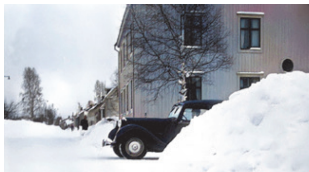
1953 Nygatan 10 med snövallar