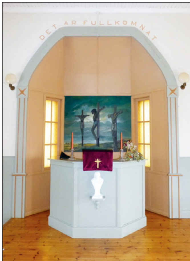
Predikstolen på sitt podium.

Byggnadsminnesförklaringen som fattades den 15 januari 2016 innebär att bönhuset och det tillhörande uthuset inte får rivas eller förändras ut- eller invändigt, att vård och underhåll ska utföras i samråd med Länsstyrelsen och att tomten inte får bebyggas ytterligare.