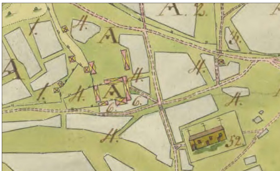
Prostgården 1764. Gården är ännu byggd i en sluten fyrkant. Kyrkan nere till höger (52)

Bönder och gårdar i Skellefteå socken 1539-1650 (Umeå, 1997) Norrländsk uppslagsbok (Höganäs, 1993)