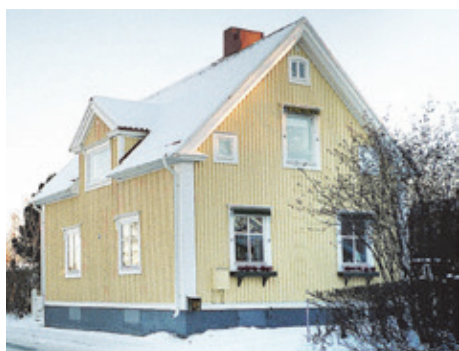
2003 Nygatan 12