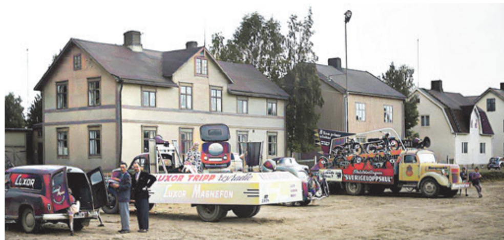
1954-07-05 Reklam-bilar vid Sverigeloppet parkerade på Dammvalla med Nygatan 16-10 i bakgrunden

År 1970 köps den av Nya Begravningsbyrån i Skellefteå AB som har sin verksamhet i fastigheten.