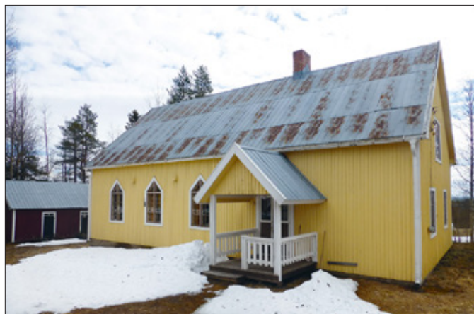
Bönhuset i Missenträsk fotograferat vintern 2015.