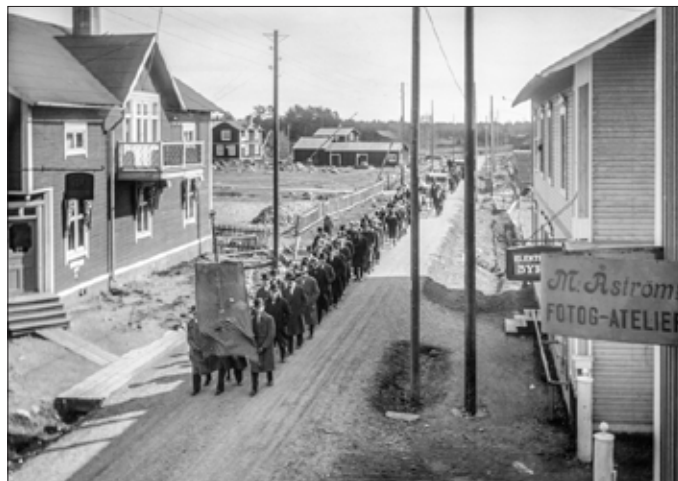
Demonstrationståg i Bureå