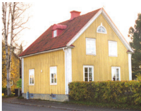
2001 Nygatan 14

1926 köps fastigheten av Georg Andersson som uppför ett hus.