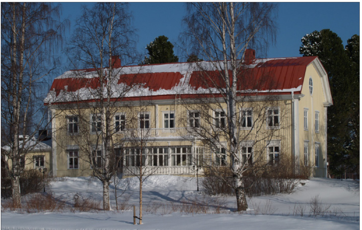
Prostgården i modernare utformning från sekelskiftet 1800. Blev stiftsgård 1964.

År 1553 redovisas i hjälpskattelängden att kyrkoherden Andreas Olai hade 10 pundland åker, vilket motsvarar 80 spannländ eller 12,8 hektar. Antalet lass äng var 40 och kornas antal var även det 40. Dessutom hade prästen 25 lass av utängar. Utängarna fanns i Antholmen i Innervik 10 lass, Kågeholm i Kåge 2 lass, Smedsmyran i Frostkåge 3 lass, Stämninggården 2 lass, Tuvan 2 lass, Åviken i Tjärn/Innervik 6 lass. Fyra