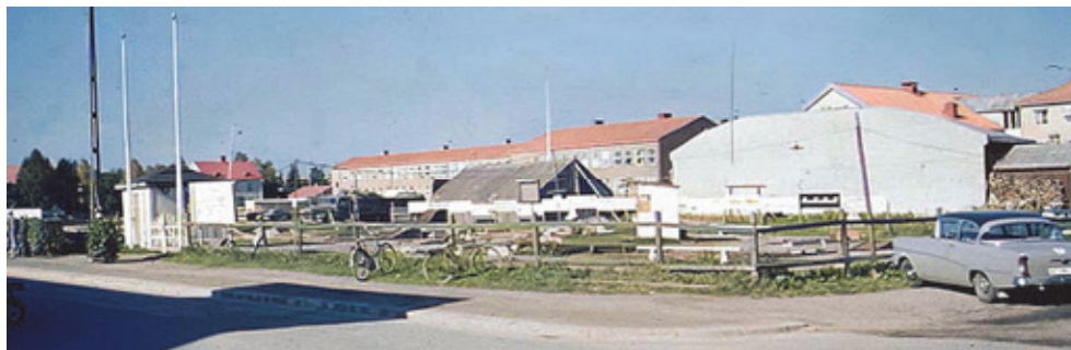
1960-09 Minigolfbana i kvarteret Frigg intill Dammvalla