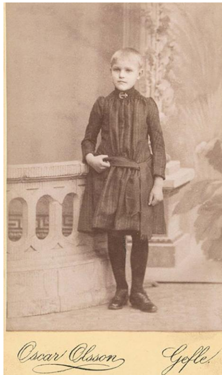
Okänd (källa Stefan Simander)