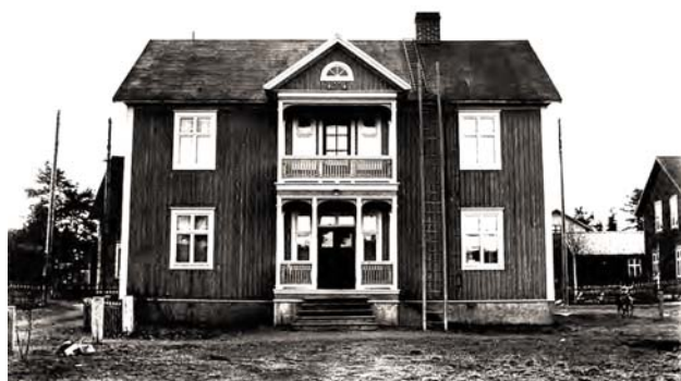
1942 Majas ateljé och bostad på Skärvägen i Bureå

Majas fotosamling bestående av 12 000 glasplåtar finns på Skellefteå museum.