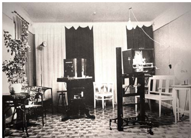
Maja Åströms ateljé