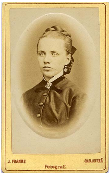
Okänd kvinna född 1862-01-20