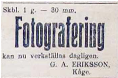
1917-10-16 Annons i NV